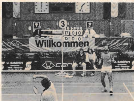
Dank Sponsorvertrag ein optisch hervorragender Eindruck

Damen: Irmgard Latz (verh. Gerlatzka) mit 7 Siegen (1961–64, 1971/72, 1976). Es folgen