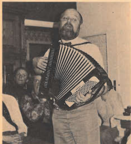
Schiedsrichter und Stimmungskanone: der überall beliebte tschech. Präsident Peter Scribeck.

Der Bericht wäre unvollständig, wenn nicht das vom örtlichen Ausrichter hervorragend gestaltete Rahmenprogramm lobend erwähnt würde. So konnten sich nach Abschluß der Mannschaftswettkämpfe Spieler und Helfer bei einer Fahrt auf dem Baldey-See neue Energie holen für die Einzelspiele. Helfer sorgten für das leibliche Wohl der Spieler und Zuschauer, wobei der Grill besonders umlagert war, auf dem massig Koteletts und Würstchen verbraten wurden.