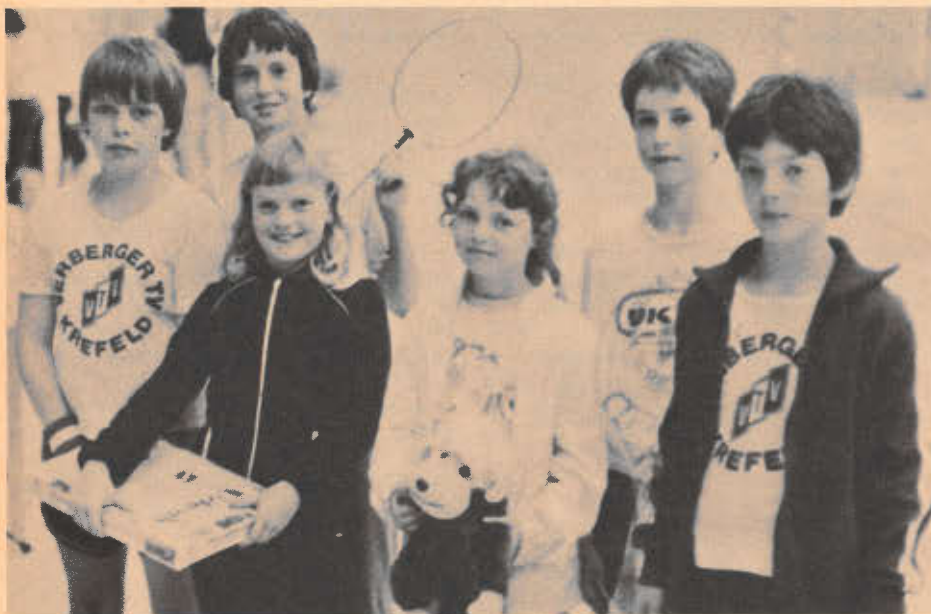
25 Jahre 1. BV Mülheim · Schülerturnier der »Erste Schritt« (17. 5. 1981): Siegerehrung