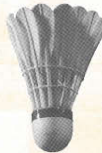
VICTOR G 1132