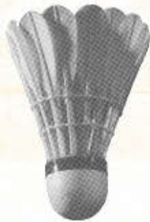
VICTOR G 1101