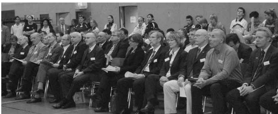
Hochgradige Gäste aus Sport und Politik

„In Mülheim an der Ruhr finden sich Trainings- und Betreuungsmöglichkeiten auf höchstem Niveau. Athen und Peking sind Vergangenheit, London und Rio warten auf uns. Gemeinsam sind wir stark und können Wünsche wahr werden lassen“, meinte DBV-Präsident Karl-Heinz Kerst bei der Eröffnungsfeier und spielte damit auf das Ziel an, das alle Beteiligten verfolgen: in naher Zukunft einen Olympiasieg durch eine Mülheimer Badmintonspielerin oder einen Mülheimer Badmintonspieler zu verzeichnen. Karl-Heinz Kerst dankte allen an dem Projekt beteiligten Institutionen, speziell dem Innenministerium des Landes Nordrhein-Westfalen, der Sportstiftung NRW, der Stadt Mülheim an der Ruhr und der Firma YONEX.