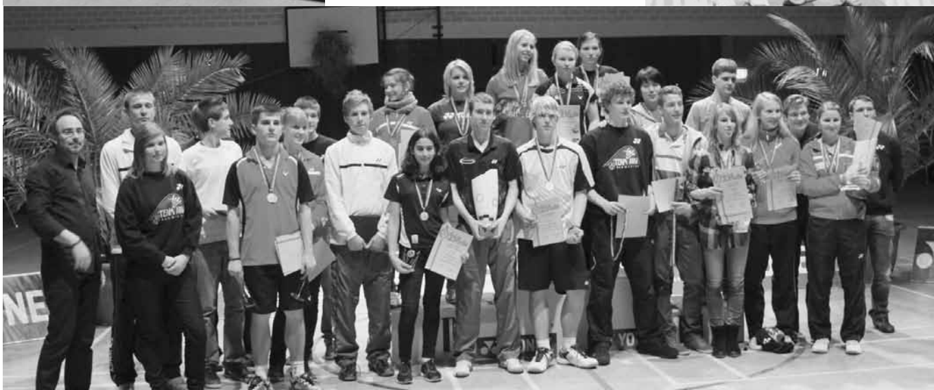
Die Medaillengewinner aus NRW