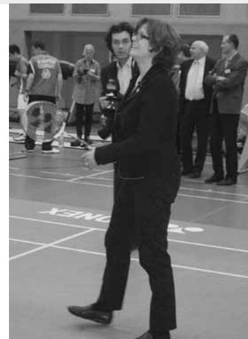
Die Ministerin Ute Schäfer

Behandlung oder für Rehabilitationsmaßnahmen zur Verfügung, der optimalen Regeneration dient unter anderem eine Sauna mit Ruheraum, und mit Hilfe einer Windanlage ist es möglich, die Bedingungen in großen Wettkampfhallen – mit ihren Klimaanlage oder Lüftungen, wie sie speziell in Asien vorkommen – zu simulieren.